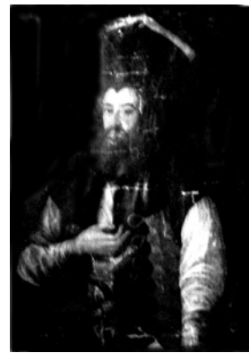
Pl. II - Al.C. Moruzi Vv. (Muzeul de Istorie Galați)