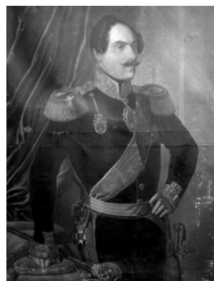
Pl. III - Grigore V Alexandru Ghica Vv.