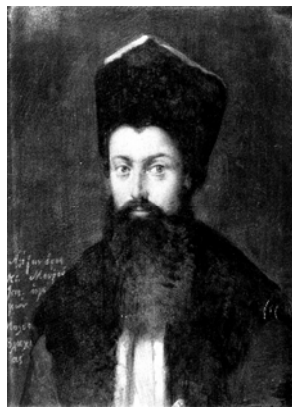
Pl. I - Al.C. Moruzi Vv. (Muzeul Societății Istorice și Etnologice din Atena)

The complex investigation of certain plastic representations – already known or recently identified – such as the historical portraits of certain voivodes / princes / reigning princes of the Romanian countries (Al. C. Moruzi, Prince of Moldavia (1792, 1802-1806) and Walachia (1793-1796, 1799-1801), Scarlat Calimach, Prince of Moldavia (1806, 1807-1810, 1812-1819) and Grigore V Alexandru Ghika, Prince of Moldavia (1849-1856)), represents a valuable contribution to the iconographic repertoire of our national history.