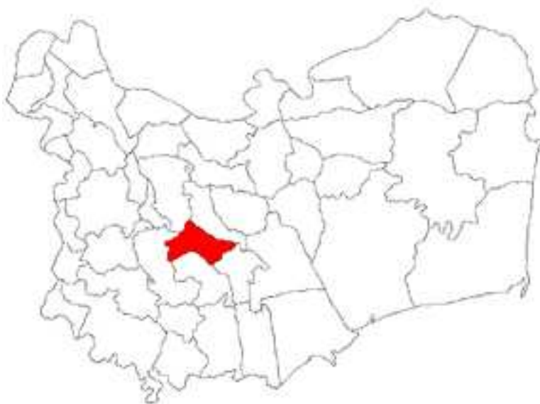
Pl. I. 1. Amplasarea com. Mihai Bravu în cadrul județului Tulcea. 1. location of the commune Mihai Bravu in Tulcea county.